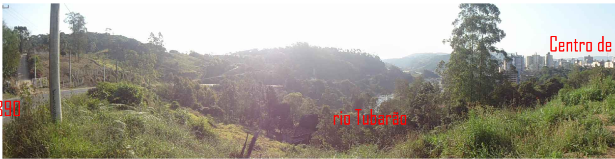
Vista Mirante: paisagem natural e construída

Parque de Fundo de Vale: vegetação existente (mata ciliar).